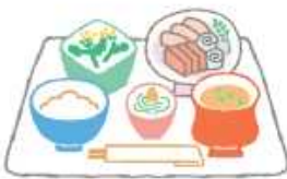
栄養バランスの良い食事

口内炎で最も一般的なアフタ口内炎は、確かな原因はわかりませんが、からだの免疫力が低下した時に、口の中の細菌によって引き起こされたり、胃腸などの内臓障害が主な原因と考えられています。予防法としては、栄養バランスの整った食事を心がける。睡眠をしっかりと、ストレスを溜めない。普段から正しいブラッシングを心がけ、お口の中を清潔に保つなどが大切です。