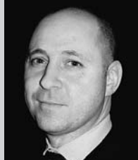
アヴィシャイ・サダン